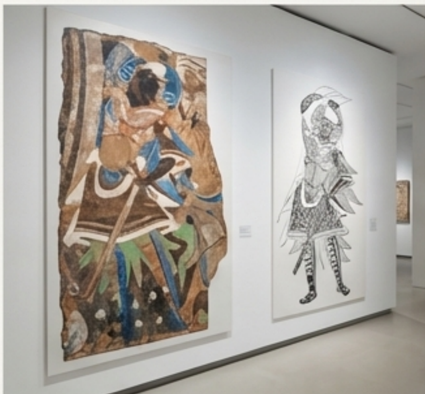
Muuseumis eksponeeritud Kizili seinamaal ja Grünwedeli joonis

“See, mida ma siin näinud olen, ületab mu kõige pöörasemadki unistused.” — Albert Grünwedel